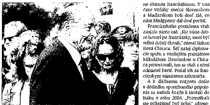
Jacques Chirac bol francúzskym prezidentom 12 rokov.

POLITIKA Život francúzskeho exprezidenta Jacqua Chiraca bol poznačený rýchlym rastom kariéry, ale aj mnohými konfliktmi.