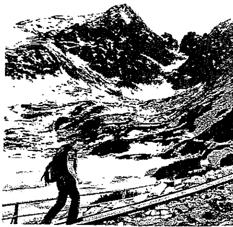
Vysoké Tatry mali nárok na slušnú štátnu dotáciu, jej prerozdelenie